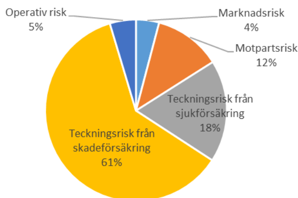
Figur 1: Riskprofil för SRF, bidragen till solvenskapitalkravet per riskkategori per 2018-12-31

Bolagets riskprofil visas i Figur 1 nedan, som fördelningen av respektive riskkategoris bidrag till solvenskapitalkravet per 31 december 2018 utan hänsyn till diversifieringseffekter mellan kategorierna.